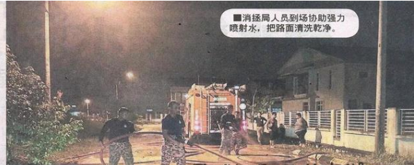
■消防局人员到场协助强力喷射水，把路面清洗乾淨。