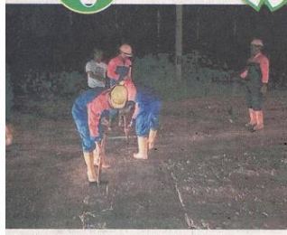
瓜冷县议会快速行动队人员正奋力清除路面泥漿。

(瓜冷5日讯)日前豪雨造成山坡防護牆坍塌，泥漿涌入紹嘉娜太子城 (Bandar Saujana Putra) 住宅区 SP9/32路，淹没部分路段，瓜拉冷岳县议会快速行动队 (SKUAD PANTAS) 与消防员，花费6小时始完成清理工作，使道路恢复原貌，方便居民及道路使用者。