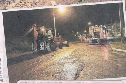
■县议会推泥机及消防局车辆也到场参与清理路面的行动。

瓜冷县议会主席莫哈末再因指出，近来气候变幻莫测，随时刮风下雨，希望县内居民随时提高警惕，也呼吁居民如有遭遇天灾意外，包括发生水患、树木遭大风吹倒，导致交通受阻等事故，立刻向有关当局作出报损或寻求援助。