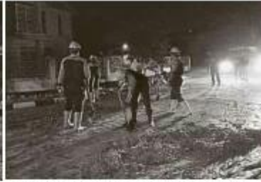
▲ 堵塞路面的泥漿已經完全被清除，恢復原狀，方便道路使用者。