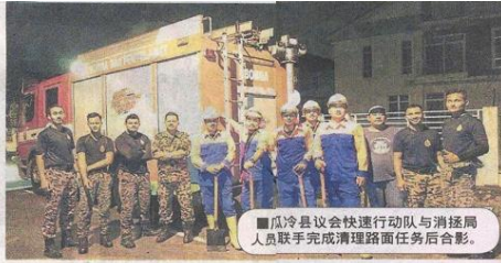
■瓜冷县议会快速行动队与消防局人员联手完成清理路面任务后合影。